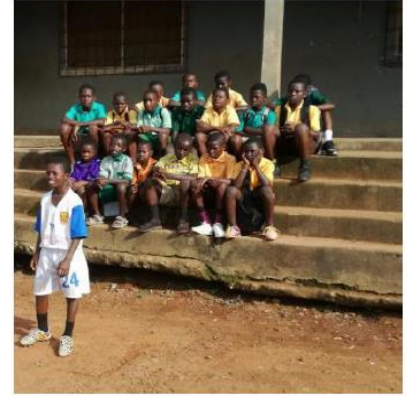
jongeren in Kitase